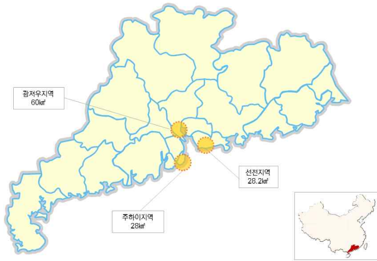
그림 2 | 광둥 자유무역시범구 분포