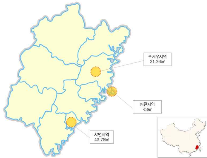
그림 3 | 푸젠 자유무역시험구 분포