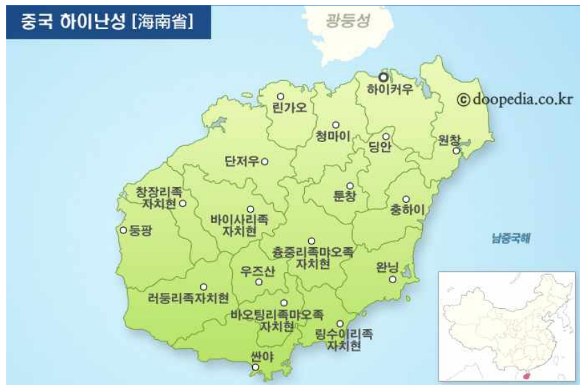
그림 1 | 하이난성 행정구역