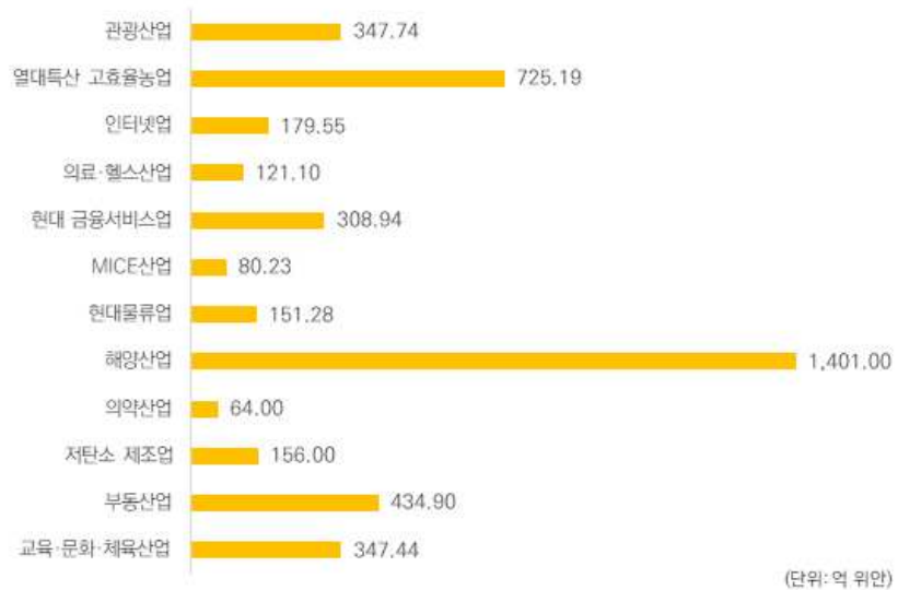
그림 6 | 하이난성 12대 중점산업 부가가치 규모(2017년)