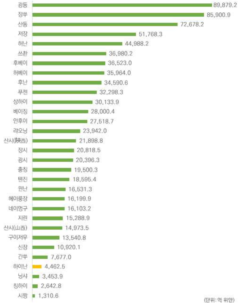
그림 3 | 중국 31개 성/시의 지역총생산 규모(2017년)