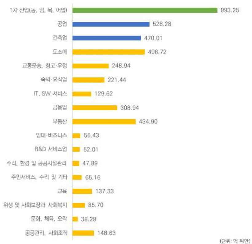
그림 5 | 하이난성 산업별 부가가치 규모(2017년)